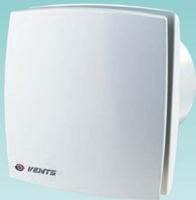
Aspiratore assiale decorativo con portata fino a 310 m 3 /h